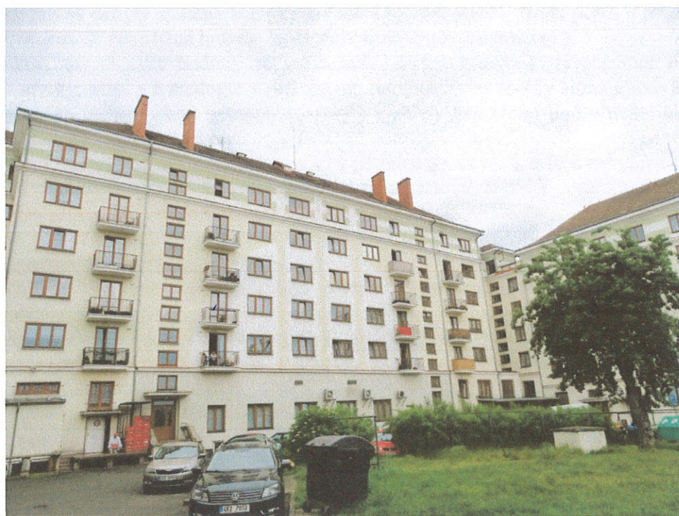
Objekty 1421 - 1428 – pohled od východu