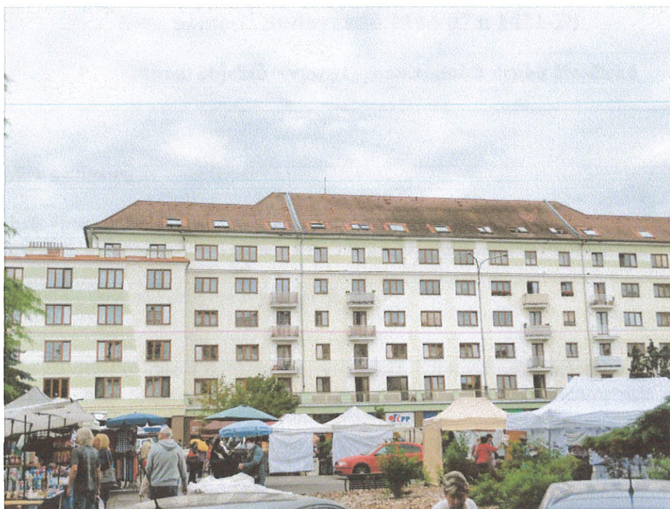
Objekt 1404 – 1407 - pohled od východu